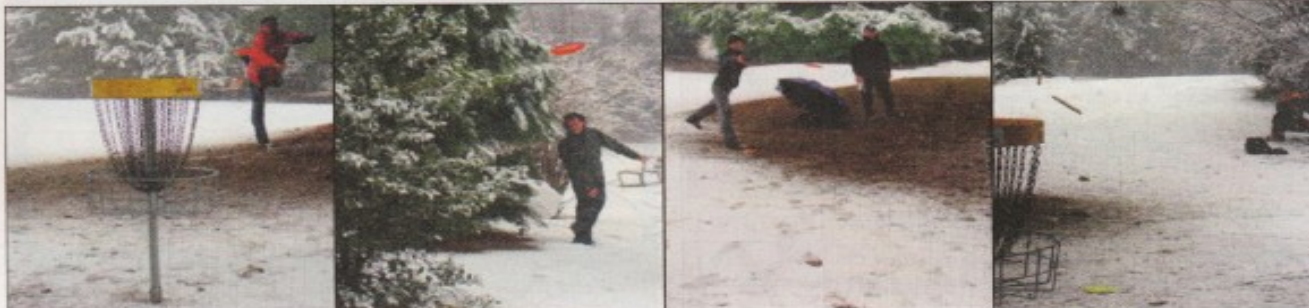
4 e manche du Championnat genevois d'hiver de Disc Golf, dimanche 22 février 2009, au Parc Stagni.