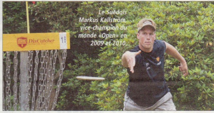
Le Suédois Markus Kallström, vice-champion du monde «Open» en 2009 et 2010.

Du jamais vu dans l'histoire de la compétition, les responsables du tournoi sont contraints, cette année, de refuser des inscriptions pour des questions d'organisation. En effet, plus de